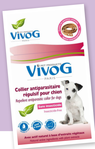
Antiparazitska ogrlica za male i srednje pse - dužine 60 cm