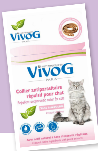
Antiparazitska ogrlica za mačke dužine 35 cm