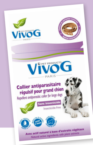
Antiparazitska ogrlica za velike pse dužine 75 cm